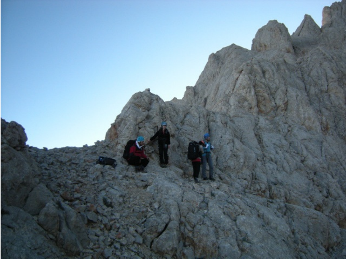
Batı yüzünden Hodgkin-Peck e geçiş yeri.