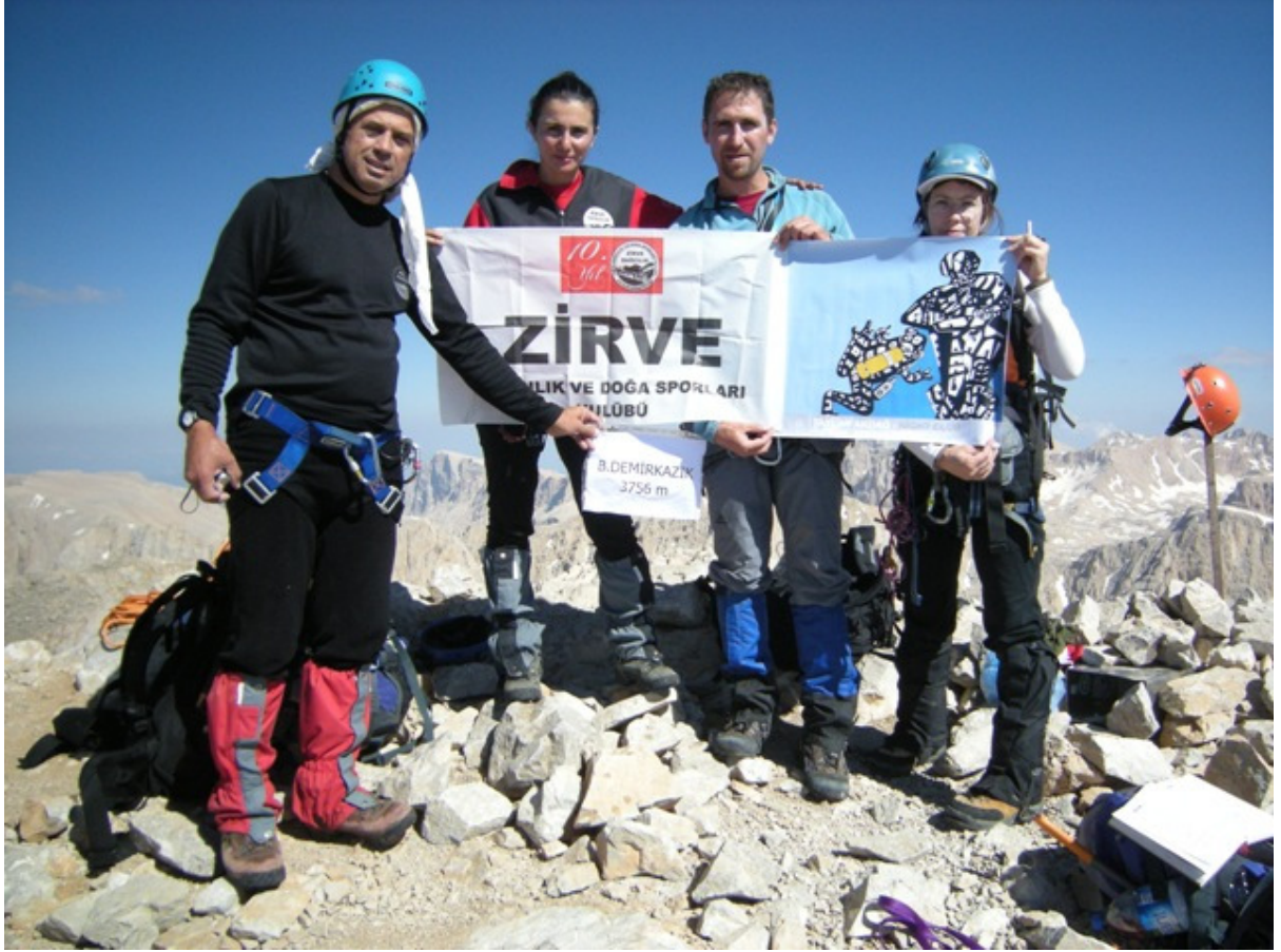
Zirve fotoğrafı. Fotoğrafi ben çektim. 😊