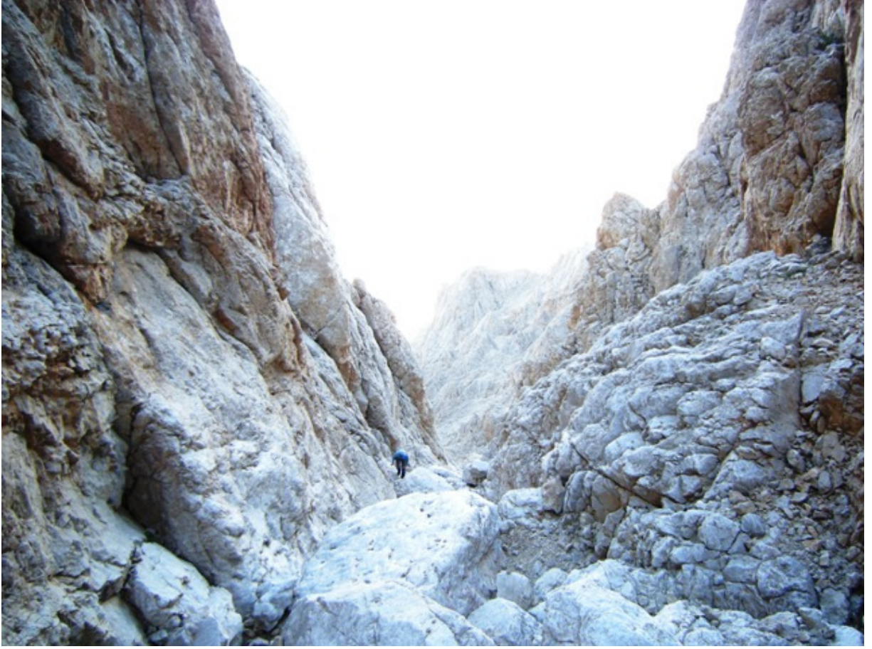
Hodgin-Peck kulvarının ii. Ařađılarının ođunlukla karsız olması sıkıntı yarattı.