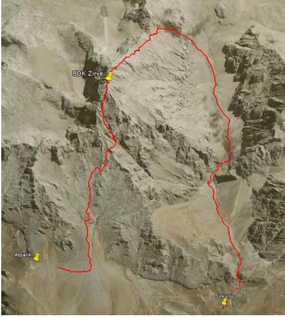
İzlediğimiz rota. GPS kayıtları.