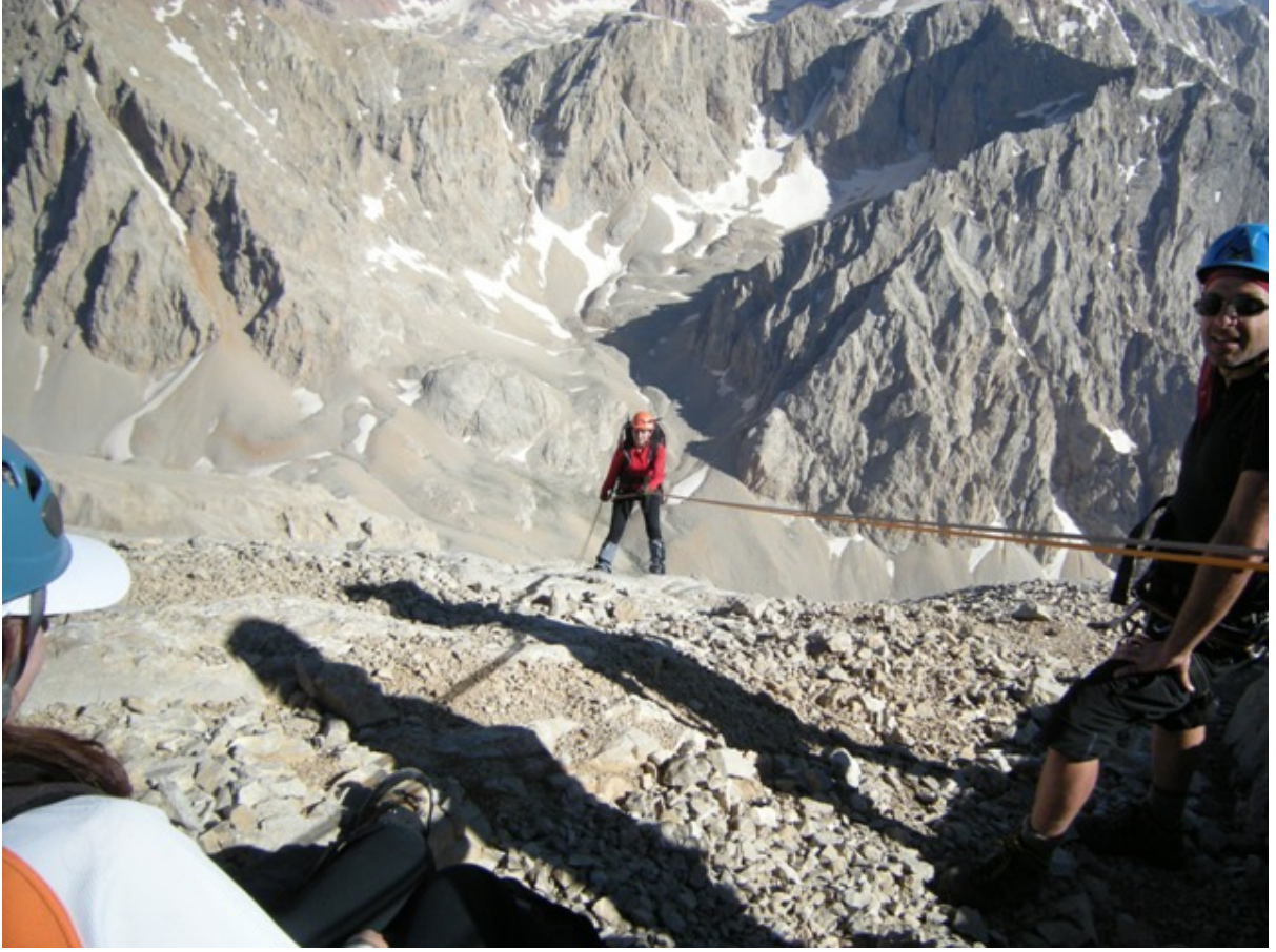
Külahtan ip inişi.