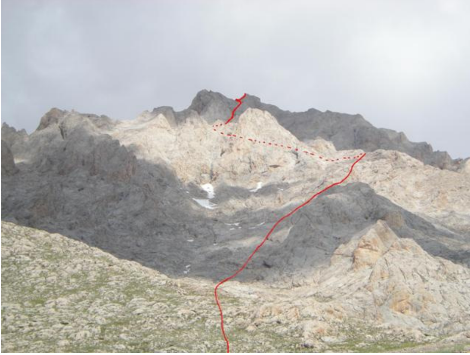
İzlediğimiz rota. El çizimi.